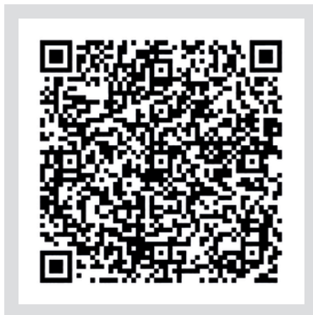
Scan mich - zur Anmeldung

„Das Außerordentliche geschieht nicht auf glattem, gewöhnlichem Wege.“