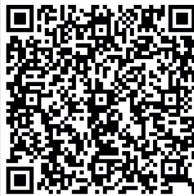
Scan mich - zur Anmeldung

„Es ist besser, einen Tag im Monat über sein Geld nachzudenken, als einen ganzen Monat dafür zu arbeiten.“