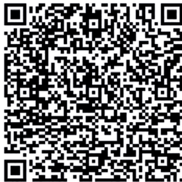
Scan mich - zur Anmeldung

Ich freue mich auf zwei spannende und arbeitsreiche Tage mit Ihnen. Trainieren Sie mit mir Heil- und Kostenpläne gemäß den aktuellen gesetzlichen Bestimmungen zu erstellen und ohne Honorareinbußen abzurechnen.