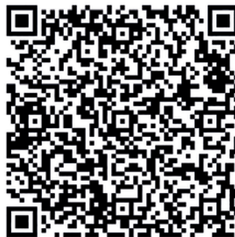
Scan mich - zur Anmeldung

„Was man sucht – es läßt sich finden, was man unbeachtet läßt – entflieht!“